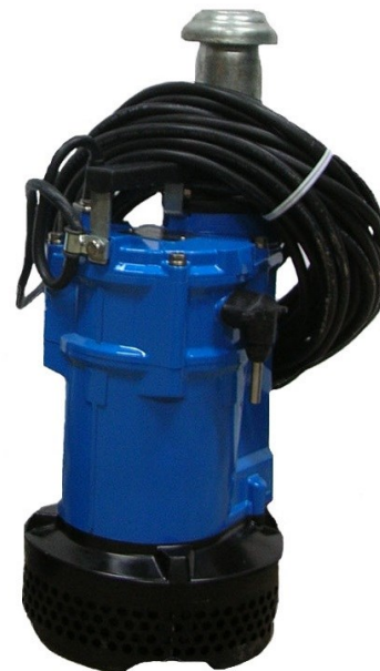
Pompa Sommersibile Mod. GEO2KTVE2.2

Passaggio max corpi solidi \varnothing 8,5 mm.