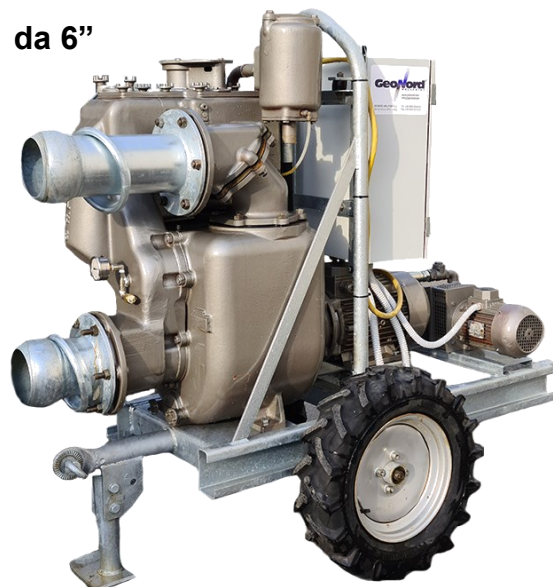
Elettropompa Mod. GEO EP6 W 1450rpm