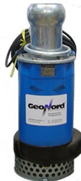
Pompa Sommergibile Mod. GEO6KRS5.5

Pompa Sommergibile da 6" per il pompaggio di acque TORBIDE, adatta al DRENAGGIO in CANTIERE e SVUOTAMENTO POZZI di DRENAGGIO