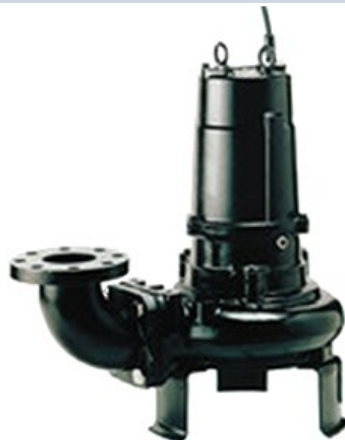
Pompa Sommersibile Mod. GEO4FNBZ7.5