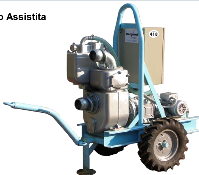
Elettropompa Mod. GEO4EPW