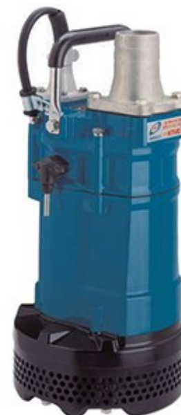
Pompa Sommersibile Mod. GEO3KTVE3.7