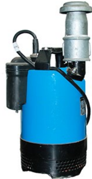
Pompa Sommersibile Mod. GEO2LB0.8A