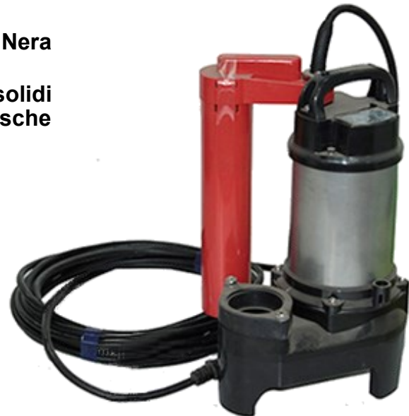
Pompa Sommergibile Mod. GEO2FNPU0.4