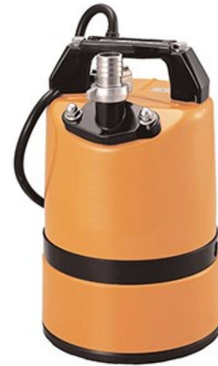
Pompa Sommersibile Mod. GEO1LSC0.4